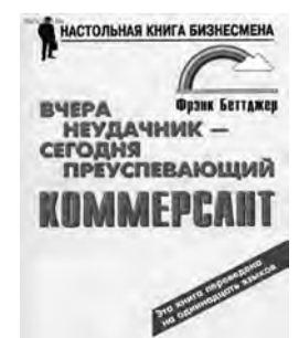
Фрэнк Беттджер «Вчера неудачник – сегодня преуспевающий коммерсант» (16+).

гаче. Сосчитали? 100, 200, 500, может быть, 1000 человек? Мой опыт общения с успешными руководителями предприятий, входящих в Союз промышленников и предпринимателей Вологодской области, говорит о том, что у многих из них список контактов превышает несколько тысяч. И постоянно растет! А на сколько человек расширился ваш список за последнюю неделю, месяц, год? За этим показателем нужно следить. Все возможности (как и неприятности) приходят в нашу жизнь через других людей. Ответственное отношение к своему окружению – залог счастливой и успешной жизни.