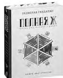
Радислав Гандапас «Полная Ж: жизнь как бизнес-проект» (16+).