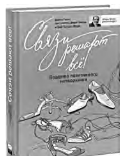
Дарси Резак «Связи решают все! Правила позитивного нетворкинга» (16+).

Подробнее о том, как работать со своим окружением и накапливать свой социальный капитал, можно прочитать в книгах: