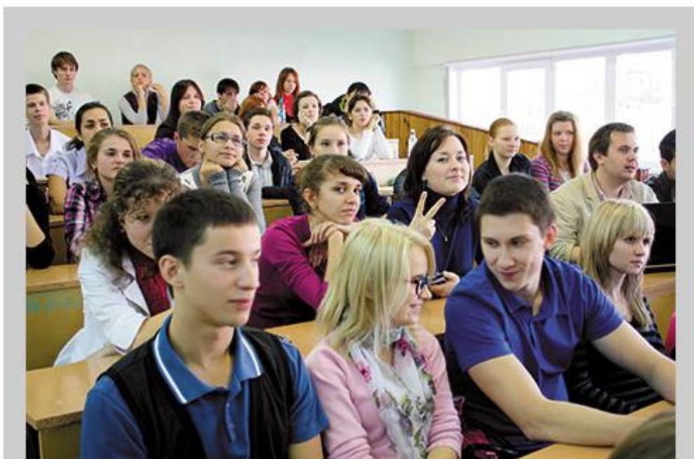
Студенческие научные конференции в ЧГУ — события ожидаемые и обсуждаемые.

Педагоги и студенты еще не отошли от объединения вологодских «педа» и «политеха», которое подавалось как обязательное условие для получения статуса опорного вуза с федеральной и региональной многомиллионной поддержкой. И вот — очередная серьезная неудача.