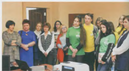
Мастер-класс, посвященный современным методам контроля качества молока, который был проведен компанией «АТЛ» (Москва), привлек внимание молодежи.

«Задача Емельяновских чтений — выйти за рамки кабинетов и наладить живое