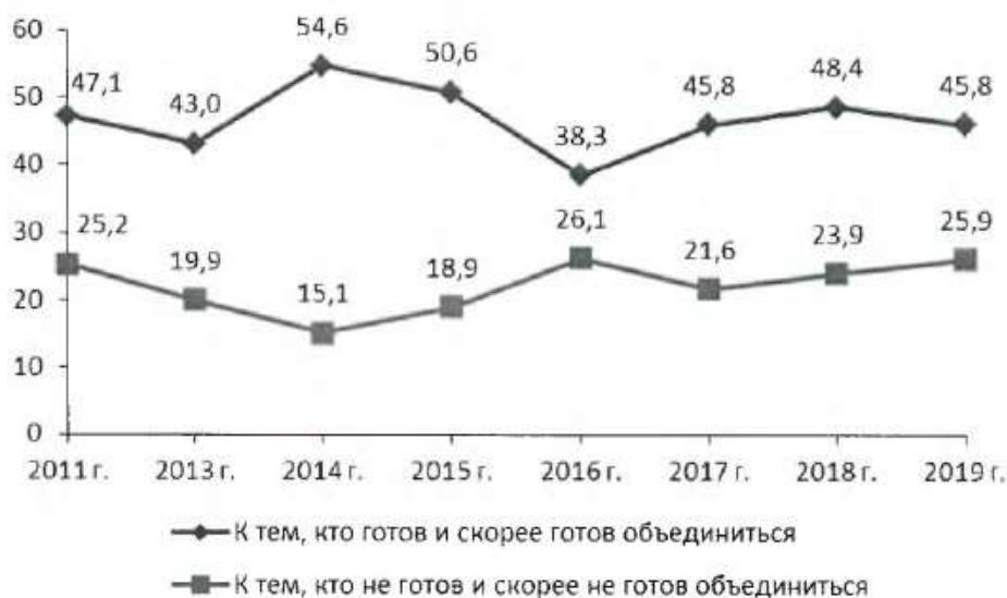
Рис. 3. Динамика оценок населения Вологодской области о своей готовности к объединению для решения общих дел, в % от опрошенных

Ответ на вопрос: «Есть люди, готовые объединяться с другими людьми для каких-либо совместных действий, если их идеи и интересы совпадают, и есть люди, не готовые объединяться. К кому бы Вы отнесли себя – к первым или ко вторым?»