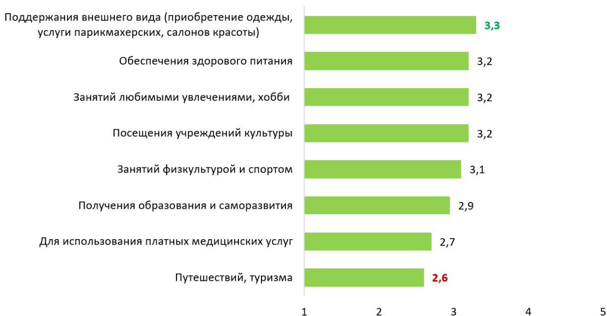
Рис. 3. Распределение ответов на вопрос «Достаточен ли для перечисленных занятий уровень Ваших доходов» (средний балл по 5-балльной шкале от «1» – абсолютно недостаточен до «5» – абсолютно достаточен)

мых сложных рабочих ситуациях (3,9 балла), а жизненный опыт пожилых помогает им избежать многих ошибок (3,9 балла). Представители самой старшей возрастной группы (70+) чаще придерживались мнения о том, что долголетие граждан – залог развития государства и общества (4,0 балла), что пожилой возраст представляет много свободного времени, для пожилых характерны мудрость, стабиль-