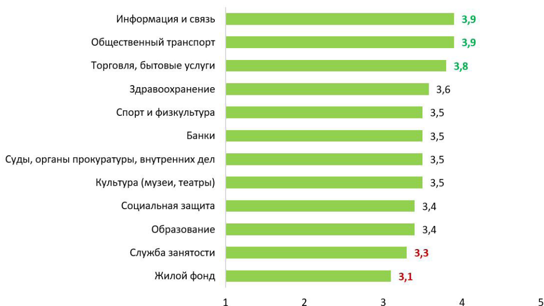
Рис. 1. Распределение ответов на вопрос «Оцените, пожалуйста, насколько доступны для Вас основные объекты и услуги в следующих сферах жизнедеятельности» (средний балл по 5-балльной шкале от «1» – совсем недоступны до «5» – полностью доступны)