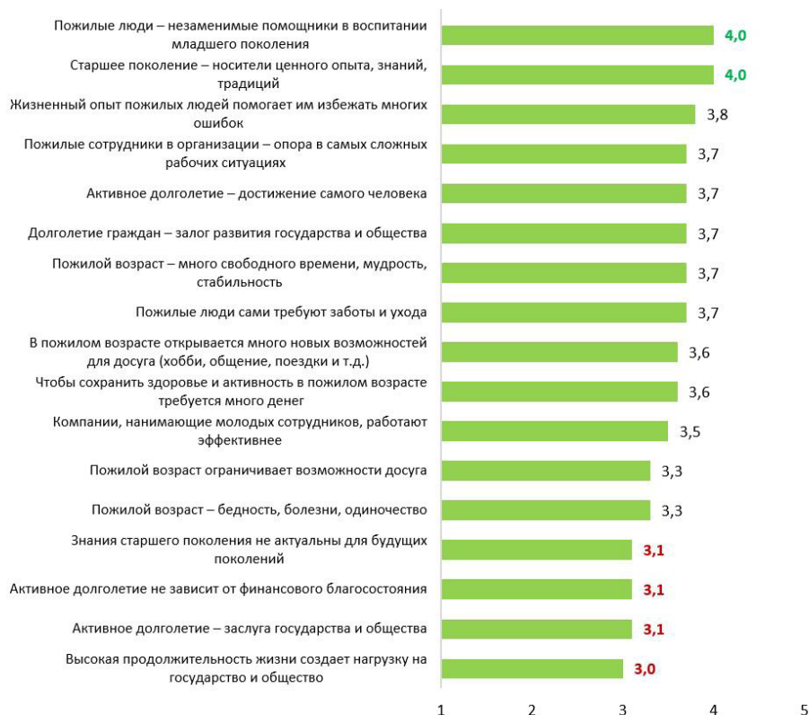
Рис. 2. Распределение ответов на вопрос «Насколько Вы согласны с перечисленными утверждениями?» (средний балл по 5-балльной шкале от «1» – категорически не согласны до «5» – полностью согласны)

демонстрировали в отношении утверждений о том, что знания старшего поколения не актуальны для будущих поколений (3,1 балла), активное долголетие не зависит от финансового благосостояния (3,1 балла) и является заслугой государства и общества (3,1 балла), высокая продолжи-